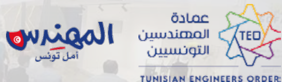
Table ronde des Ingénieurs OIT