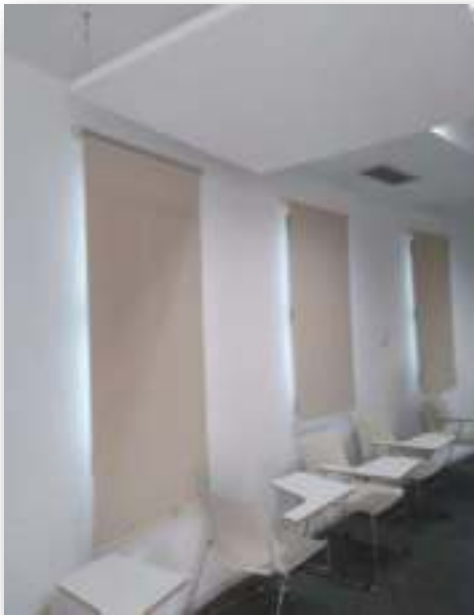
Salle de TP