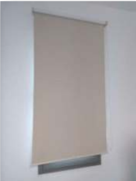
Salle des Enseignants